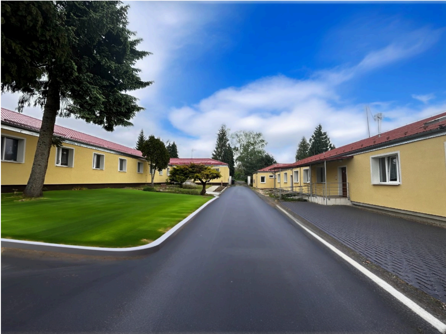
Fotografie vizualizace (venkovní úprava) - Fanda/Natalie